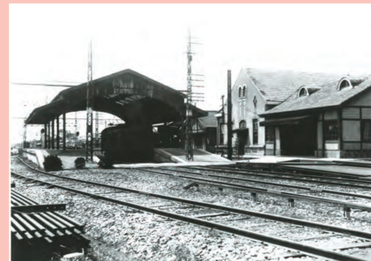
久留米駅プラットホーム(昭和7年)

九州鉄道により大正13年、福岡・久留米間に電車が走り、「急行電車」と称され、55分で走った。運賃64銭。駅前に流行の乗合自動車(フォード)、急ぎ足の袴姿の女学生。