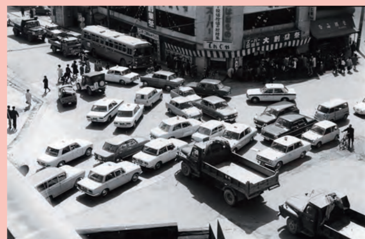
混雑する十字路 (昭和43年)

六ツ門より西を望む。青年会議所が募金して植えた植えた銀杏並木も稚木。すっかり道路拡幅も完了し町並も整っている。