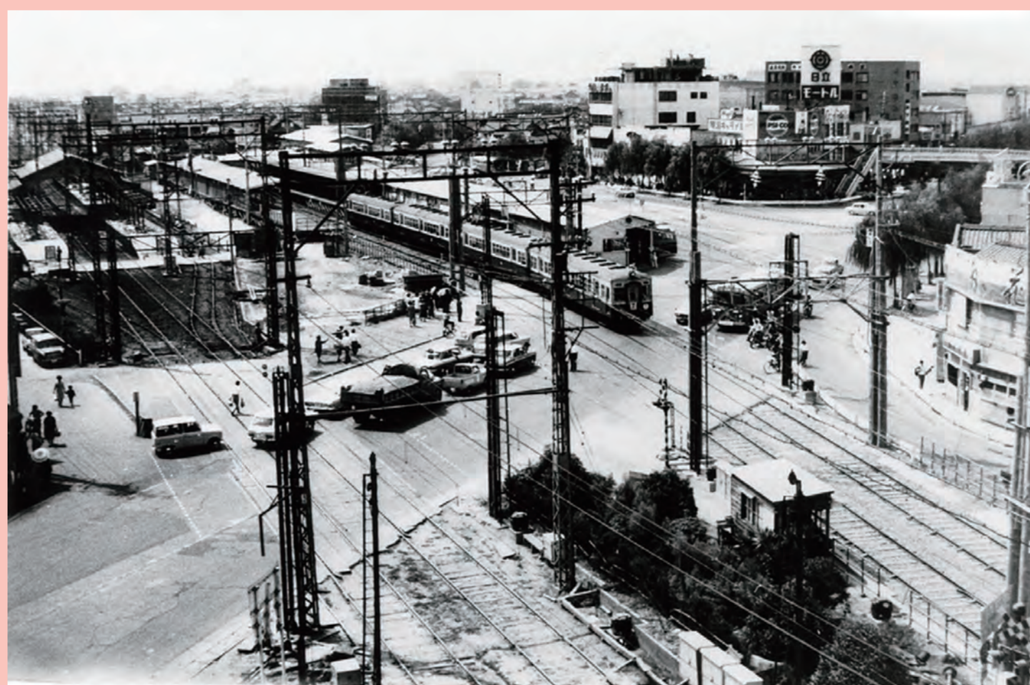
西鉄大牟田線の高架化 (昭和42年)

現在では久留米市の表玄関として繁華な西鉄駅辺りも40年代以前はこんな静かな風景があつた。