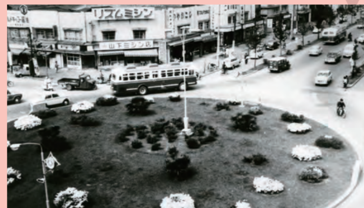
本町ロータリー (昭和30年)

ようやく戦災復興事業で明治通りは10メートル拡幅に着手された。中央に往時の道路を語る電柱が並ぶ。