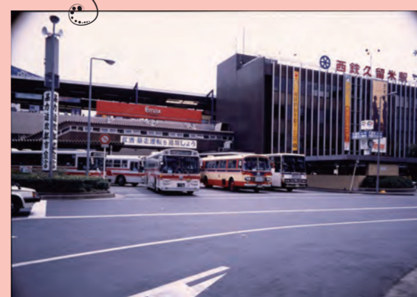
現在の西鉄久留米駅