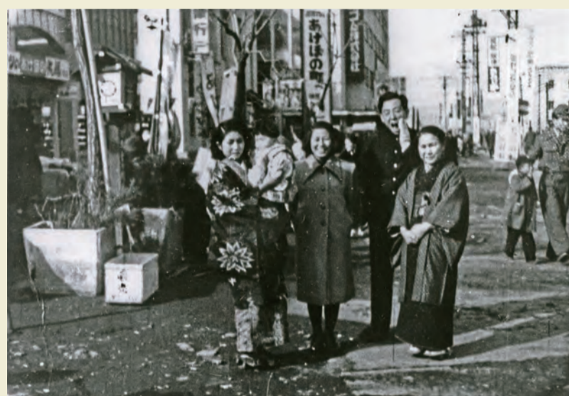
あけぼの商店街で (昭和26年)

ヤミ市時期を終え、市内各所に商店街ができた。21年12月開店のあけぼの商店街は、29年には129軒と市内最大の商店街へ。中央部の六角堂が名物だった。