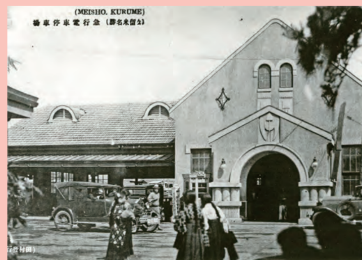
開通間もない九鉄久留米駅 (大正末)

九州鉄道により大正13年、福岡・久留米間に電車が走り、「急行電車」と称され、55分で走った。運賃64銭。駅前に流行の乗合自動車(フォード)、急ぎ足の袴姿の女学生。