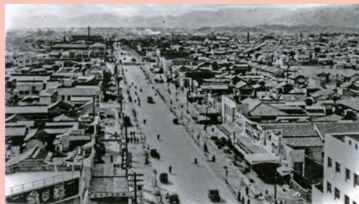
明治通りの拡幅(昭和25年)

ようやく戦災復興事業で明治通りは10メートル拡幅に着手された。中央に往時の道路を語る電柱が並ぶ。