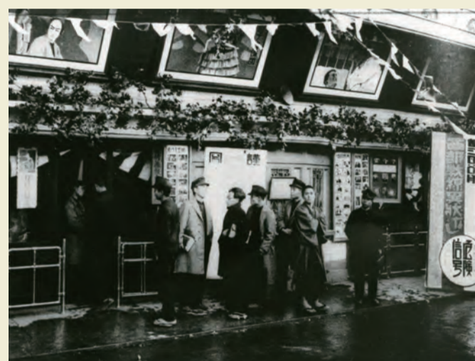
娯楽の王座は映画館(昭和初期)

日吉町路上の市場のネオン看板は左に入口を示す。手前左に本町1丁目角の大石喜楽堂書店が見える。この市場は昭和6年から、公設市場移転跡をうけて私設で営まれていた。