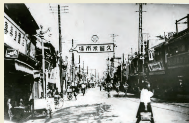
明治通りと久留米市場 (昭和12年)

上にWELCOMEとある久留米市場のネオンは右写真の夜景。右に菓子の「古賀庄」、[宗野時計店]の丸いネオンがある。