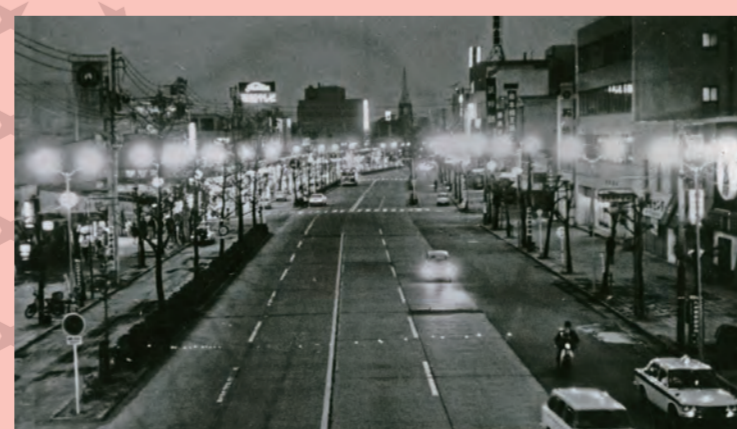
水銀灯点る (昭和46年)

国道3号線と210号線が交わり、加えて西鉄電車が斜行する。混雑・踏切は名物に近かった。昭和41年駅の解体から西鉄高架化が着手。44年に完成した。