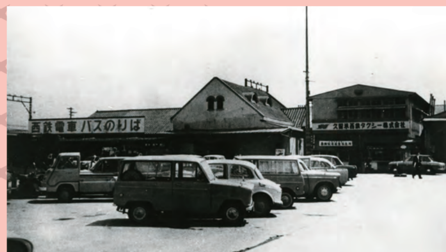
戦後改築の西鉄駅(昭和25年)

現在では久留米市の表玄関として繁華な西鉄駅辺りも40年代以前はこんな静かな風景があつた。