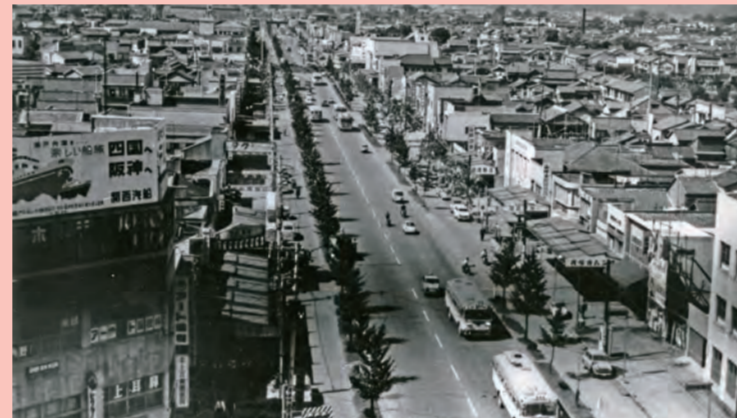
復興した明治通り (昭和40年)

昭和29年、本町通り・小頭町通り・三本松公園通りが明治通りと交叉する位置に設置されたが、同42年、交通事情から撤去された。