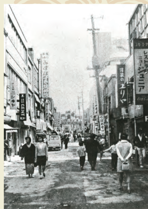
青空の一番街 (昭和45年)

ヤミ市時期を終え、市内各所に商店街ができた。21年12月開店のあけぼの商店街は、29年には129軒と市内最大の商店街へ。中央部の六角堂が名物だった。