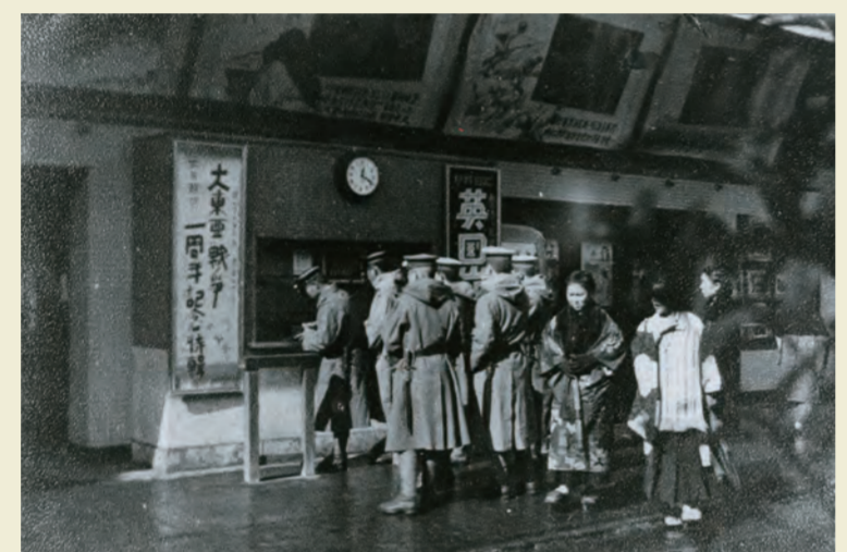
戦時中の映画館 (昭和17年ごろ)

当時は東町に友楽館(旧ライオン館)、西町尾関町に太陽館、日吉町に旭館・映画倶楽部・聚楽座が歓楽街の中にあつた。九州医専生の姿が見え、看板は、「西部戦線異常なし」。