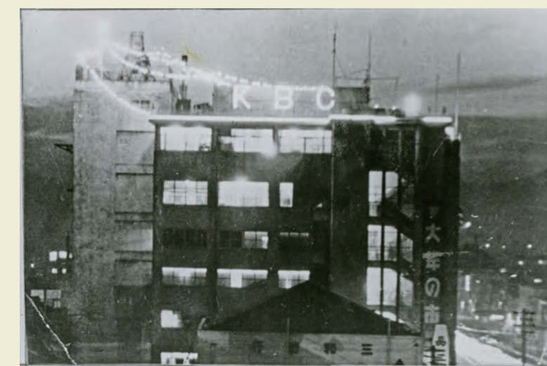
KBC久留米で誕生し放送開始 (昭和29年1月)

西鉄駅前から六ツ門通りに至るひなびた古道は、戦災後姿を一変。西鉄通り、一番街へと発展もめざましく、45年8月アーケード完成。